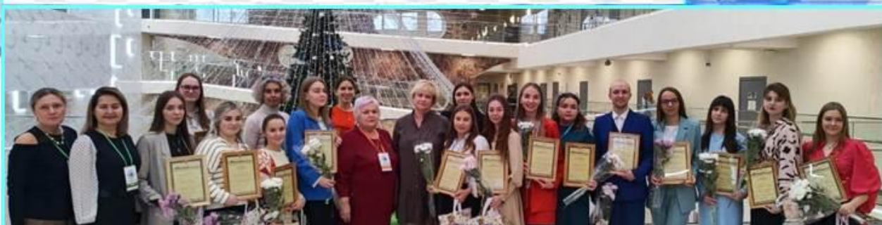
Муниципальный этап Всероссийского конкурса «Педагогический дебют»