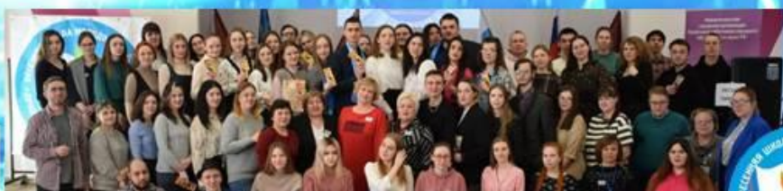
Весенняя школа молодого педагога «Вместе к успеху!»

Круглый стол с молодыми педагогами «Слагаемые успеха!», организованные городским комитетом Профсоюза, в них приняло участие более 100 молодых педагогов - членов Профсоюза