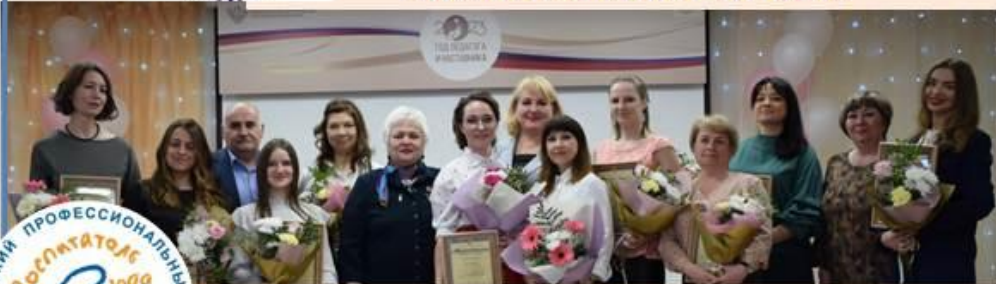
Муниципальный этап Всероссийского конкурса «Воспитатель года»