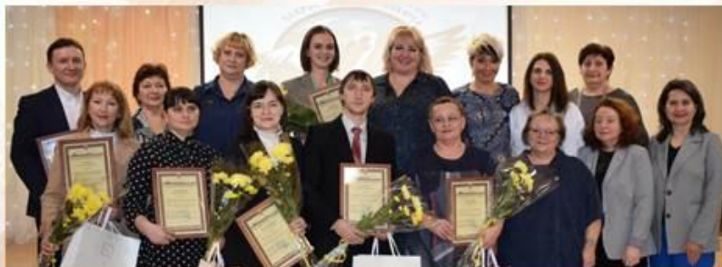
Муниципальный этап Всероссийского конкурса «Учитель года» в 2022-2023 году

ГК Профсоюза Совместно с управлением образования проведены в 2023 году муниципальные этапы Всероссийских конкурсов