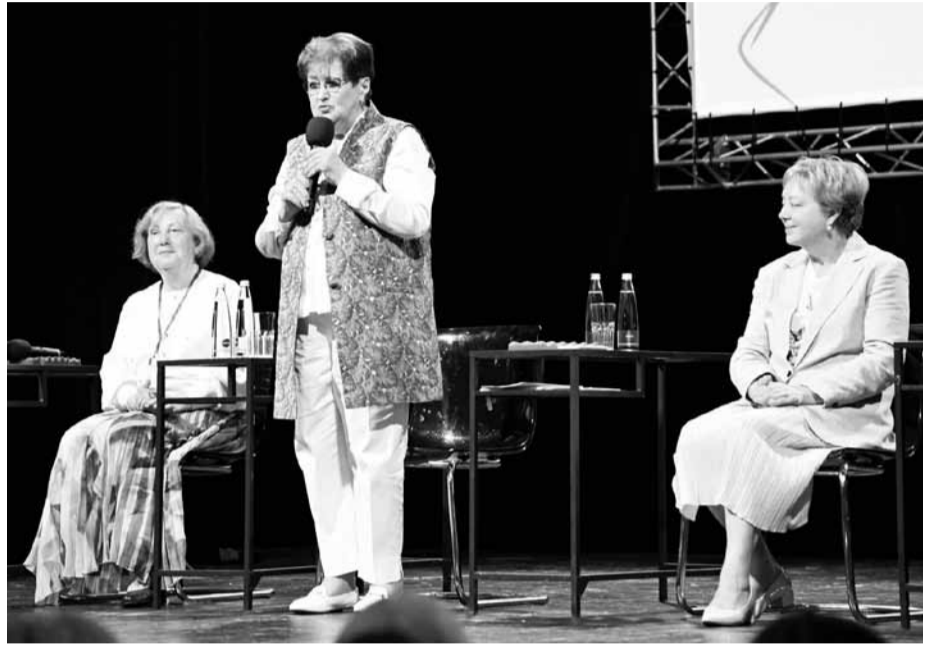
Галина МЕРКУЛОВА выступает на пленарном заседании форума

Были дистанционные приветствия от министра просвещения Сергея Кравцова, губернатора Псковской области Михаила Ведерникова, президента РАО Ольги Васильевой. И живое обсуждение статуса русского языка, проблем преподавания предметов гуманитарного цикла, использования цифровых технологий на уроках, многих