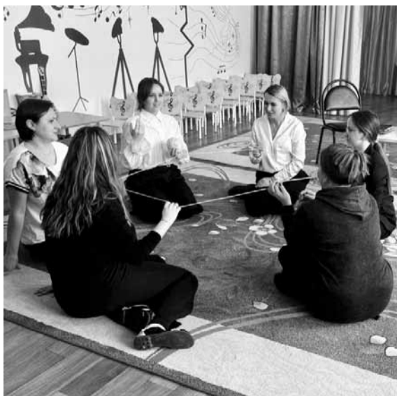
Тренинг по сплочению коллектива

Садик у нас большой, более 50 сотрудников. Сейчас профсоюзное членство составляет 100%, но так было не всегда. Когда я пришла, охват был меньше. Совместно с заведующей мы провели большую работу по вовлечению сотрудников в профсоюз. Да и сейчас она не прекращается, ведь к нам приходят новые люди.