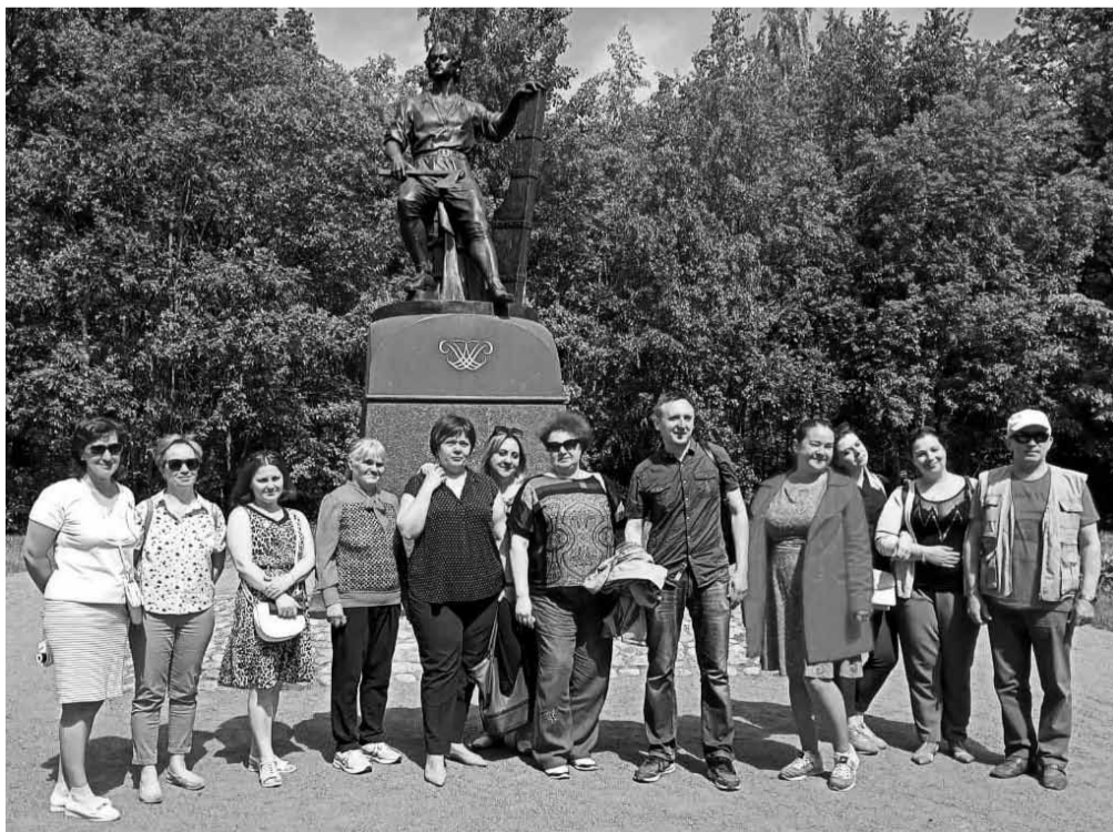
Важно и работать с удовольствием, и отдыхать с пользой