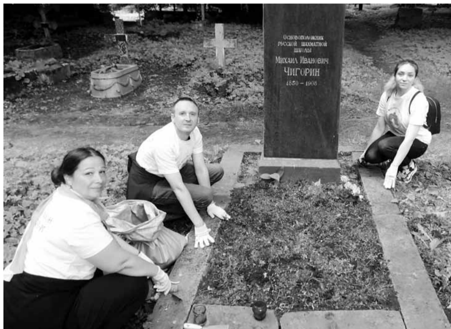
В заботливых руках педагогов сохраняется история